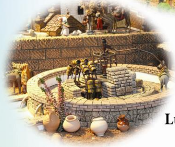
Montaje Luis León Pérez (EMASESA)