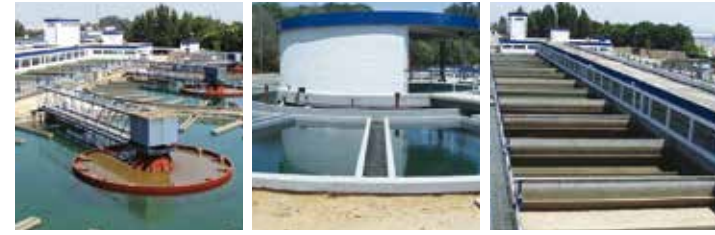
Decantador Turbocirculator Decantador Acelator Filtros de arena