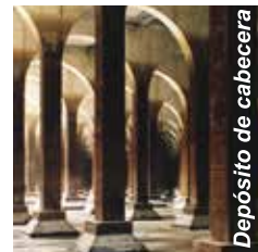
Depósito de cabecera