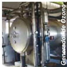
Generador de Ozono