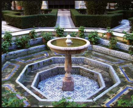
Fuente del claustro del convento de los Terceros, sede de EMASESA.

La publicación que tiene en sus manos reúne las obras ganadoras del VIII Certamen Literario del Agua que anualmente organiza la empresa metropolitana de aguas de Sevilla, EMASESA. Este certamen, de ámbito internacional, tiene como objetivo la concienciación social sobre la importancia de realizar un uso sostenible del agua, promover la reflexión en torno a la idea del agua como Derecho Humano y, así mismo, incentivar la creación literaria.