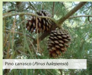
Pino carrasco ( Pinus halepensis )