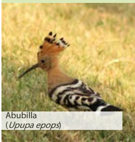
Abubilla ( Upupa epops )