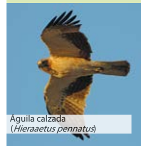
Águila calzada ( Hieraetus pennatus )