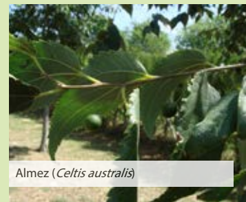
Almez ( Celtis australis )