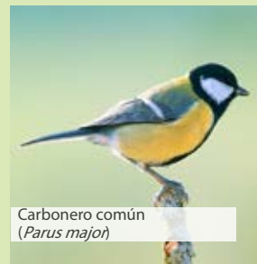
Carbonero común ( Parus major )