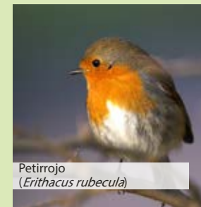
Petirrojo ( Erithacus rubecula )