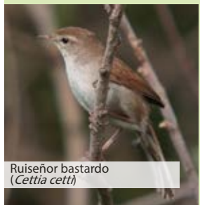
Ruiseñor bastardo ( Cettia cetti )