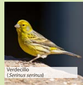
Verdecillo ( Serinus serinus )