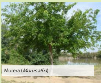
Morera ( Morus alba )