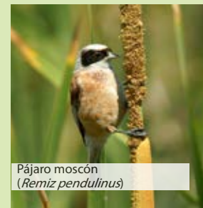
Pájaro moscón ( Remiz pendulinus )