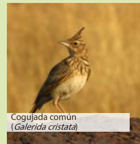
Cogujada común ( Galerida cristata )