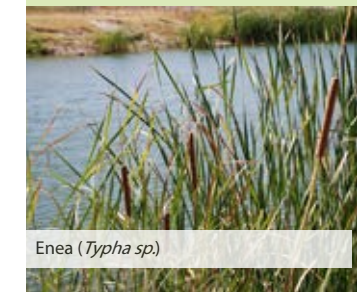
Enea ( Typha sp. )