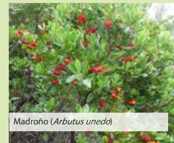
Madroño ( Arbutus unedo )