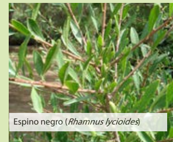
Espino negro ( Rhamnus lycioides )