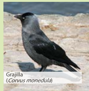
Grajilla ( Corvus monedula )