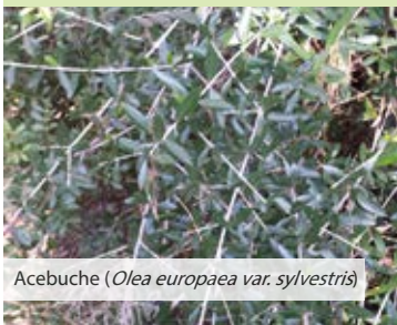
Acebuches ( Olea europaea var. sylvestris )