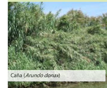
Caña ( Arundo donax )