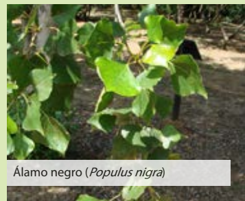
Álamo negro ( Populus nigra )