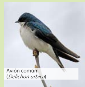
Avión común ( Delichon urbica )