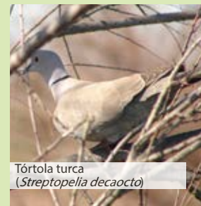
Tórtola turca ( Streptopelia decaocto )