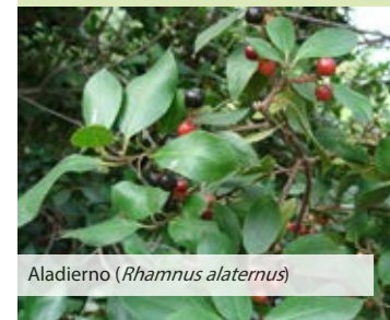
Aladierno ( Rhamnus alaternus )