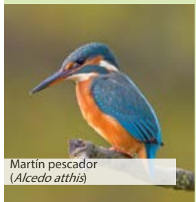
Martín pescador ( Alcedo atthis )