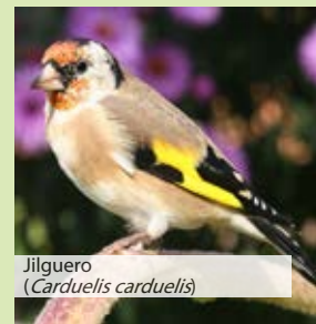
Jilguero ( Carduelis carduelis )