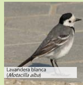
Lavandera blanca ( Motacilla alba )