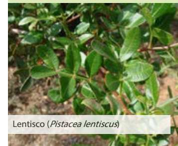
Lentisco ( Pistacea lentiscus )