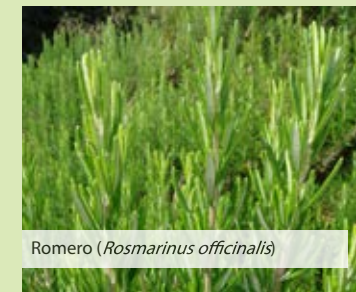
Romero ( Rosmarinus officinalis )