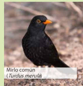
Mirlo común ( Turdus merula )