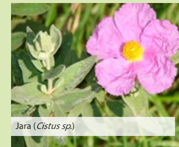
Jara ( Cistus sp. )