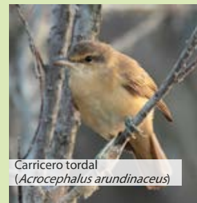
Carricero tordal ( Acrocephalus arundinaceus )