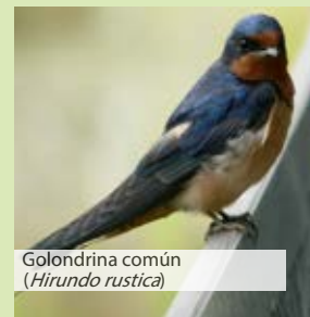
Golondrina común ( Hirundo rustica )