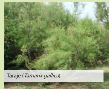
Taraje ( Tamarix gallica )