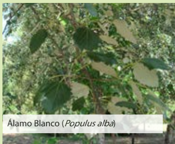
Álamo Blanco ( Populus alba )