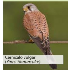
Cernícalo vulgar ( Falco tinnunculus )