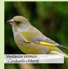
Verderón común ( Carduelis chloris )