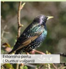
Estornino pinto ( Sturnus vulgaris )