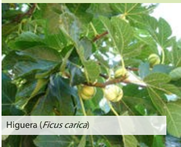
Higuera ( Ficus carica )