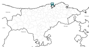
Figura 1. Ejemplo de figura.